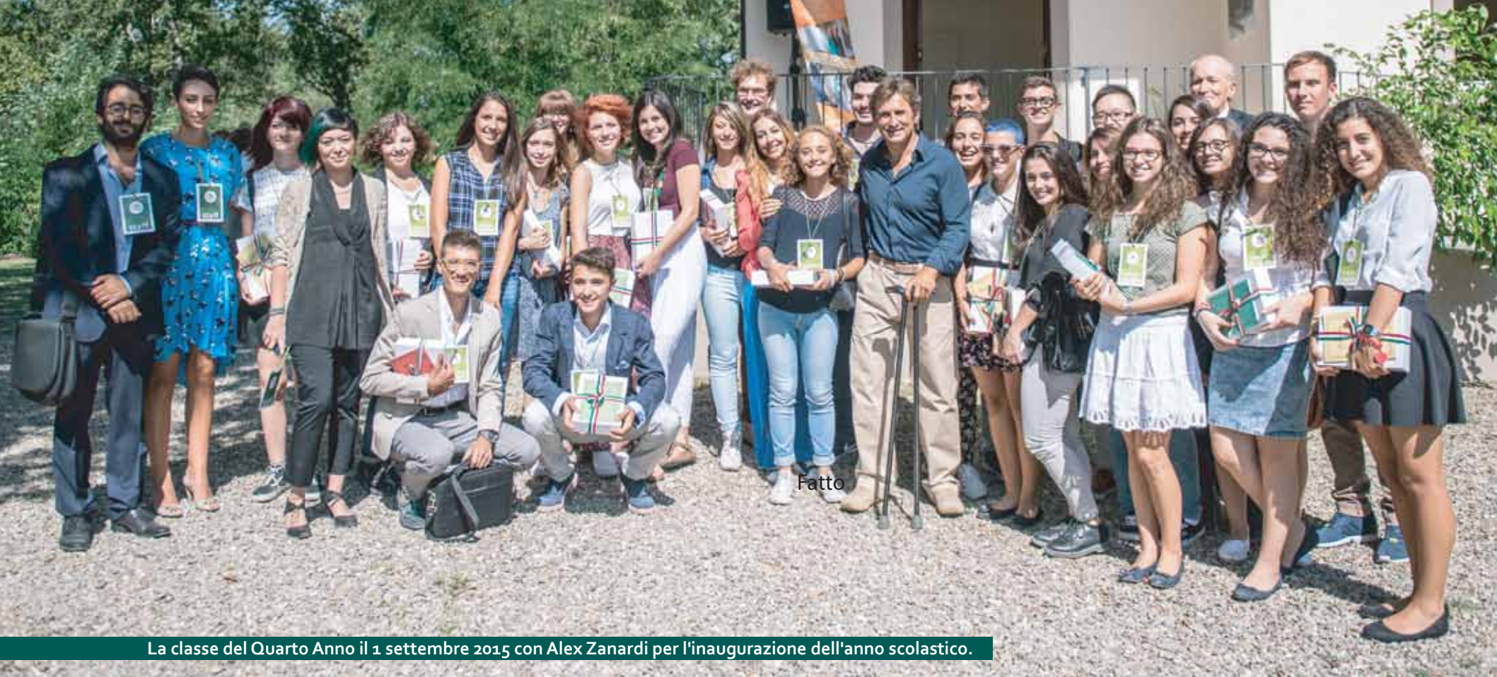
La classe del Quarto Anno il 1 settembre 2015 con Alex Zanardi per l'inaugurazione dell'anno scolastico.