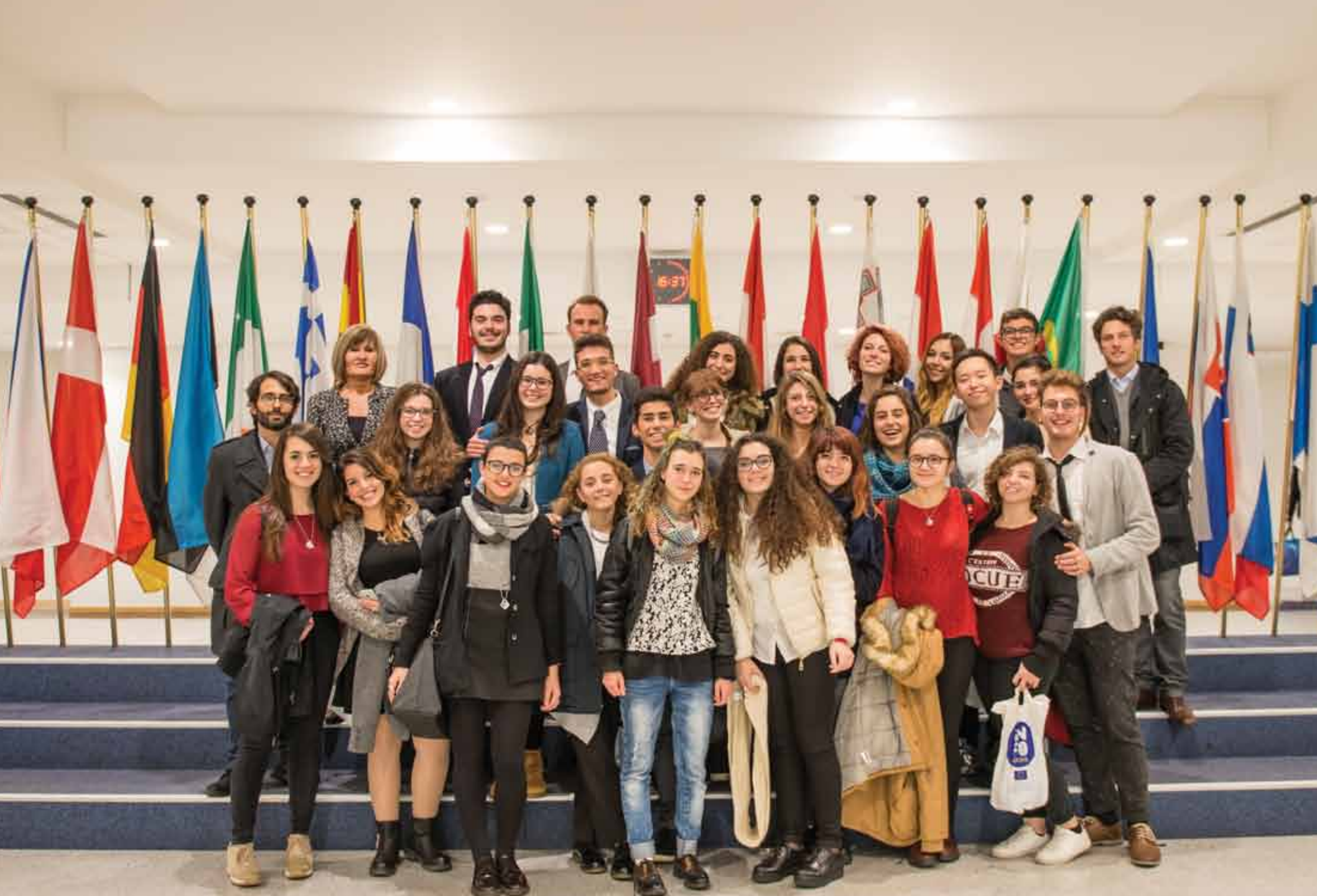
La classe del Quarto Anno nel loro viaggio studio a Bruxelles